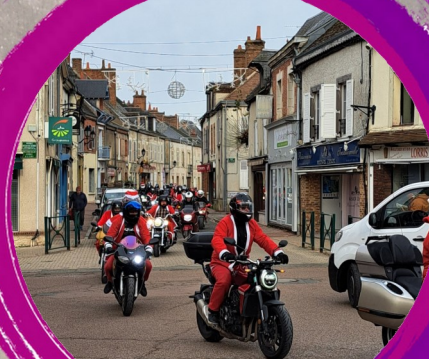
Balade des Pères Noël en moto