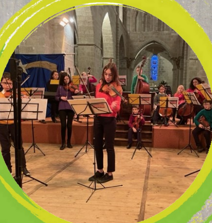
Concert du VLAD à l'Eglise