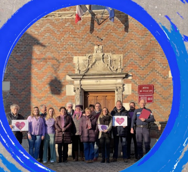
Journée internationale de l'épilepsie