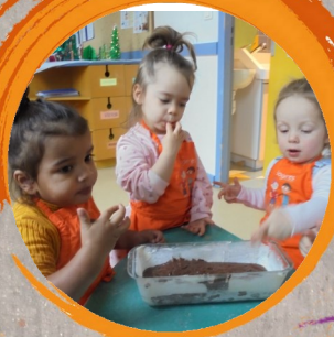
Noël à la crèche